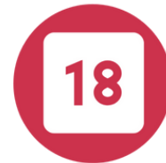
Le numéro unique d'urgence