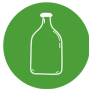
Les conteneurs à verre