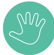
La Journée des Droits des Enfants