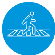
Les rues piétonnes